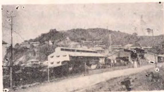
QUEPOS. —Sitio donde estaba en 1936 el Comisariato de la Compañía. Ahora está instalado allí el Colegio de Quepos.