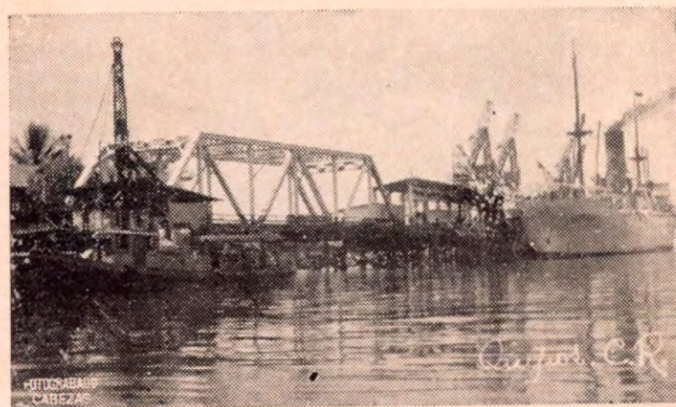
Muelle de Quepos, hoy abandonado por la Pananera, fue hace pocos años, el punto de embarque de fruta.