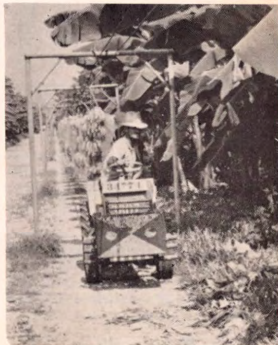
Sacando el banana de la plantación en pequeños tractores - Golfito.

Es el viejo Dios cantando por Homero, pero ha sido transfigurado. En su reposada eternidad, no denota los propósitos aventureros del Zeus mitológico, ni siquiera muestra huellas, de travesuras ya consumadas. Es una figura de perfecta plenitud. Y como tal es pura actualidad sin anhelos de ser otra cosa ni añoranza de lo que ha sido; un dios sin pasado y sin futuro: un presente inmóvil... como las ideas de Platón.