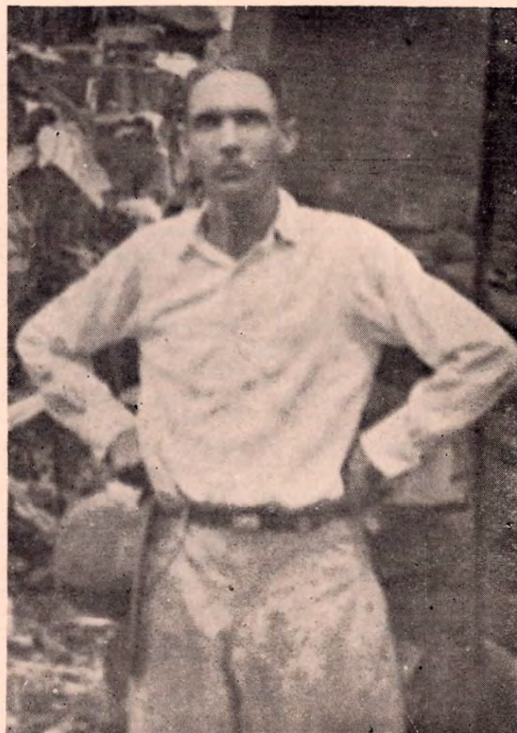
Sobresalió y triunfó en una empresa de titanes.

Hubo necesidad de adquirir pequeñas embarcaciones, La Yavisa, la primera; se construyeron campamentos; se organi-